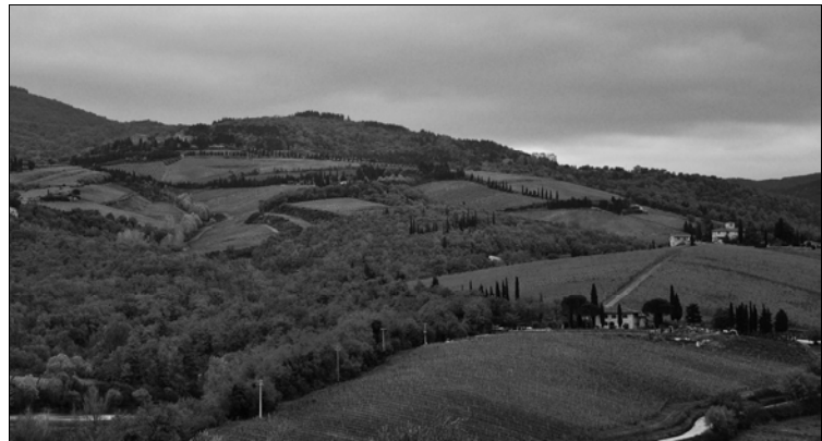
Figure 6. The archetype of modern Tuscan countryside: a nice spot in Chianti, varied and sorted by anthropic design. In this view there are eight sample plots.

Figura 6. L'archetipo del paesaggio rurale toscano moderno: un angolo del Chianti curato, variegato, ordinato secondo il disegno antropico. In questa veduta si trovano otto aree di saggio.