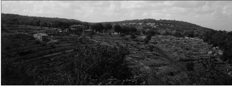
Figura 5. Situazione ibrida con vecchi olivi sotto i quali vive una prateria cespugliata.

Figure 5. Hybrid situation with old olive trees with a bushy grassland underneath.