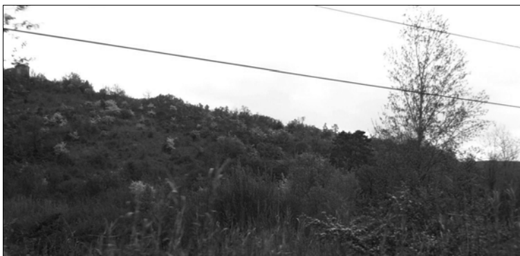
Figura 3. Arbusteto deciduo con olmo e pino marittimo, 40 anni dopo l'abbandono dell'agricoltura.