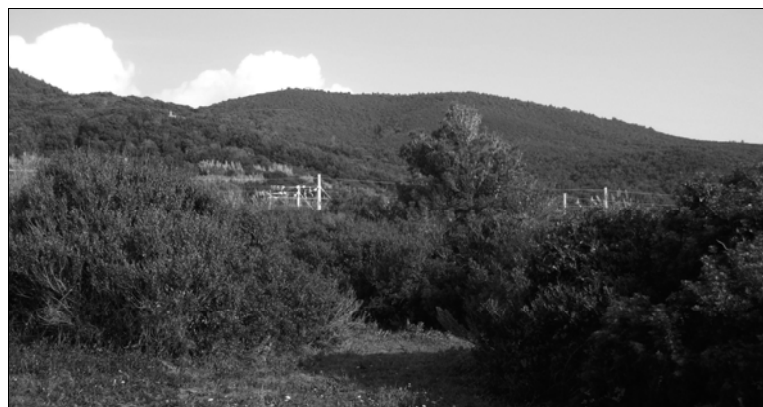
Figura 4. Macchia mediterranea post-culturale con pino d'Aleppo dopo due incendi boschivi.