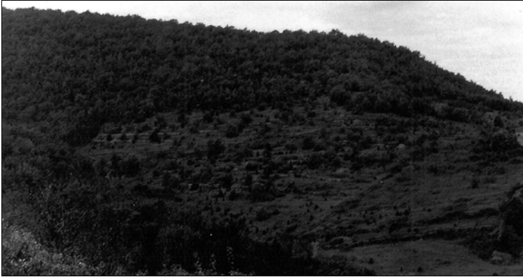
Figura 1. Successione secondaria nel Chianti nel 1983, circa 20 anni dopo l'abbandono dell'agricoltura.